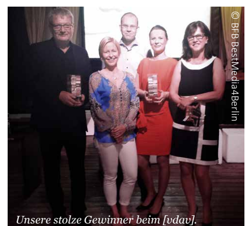
Unsere stolze Gewinner beim [vdav].