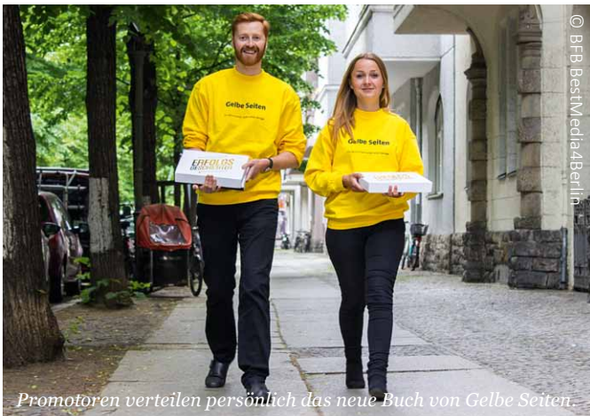
Promotoren verteilen persönlich das neue Buch von Gelbe Seiten.

Tel.: 030/86 30 3-0 • Fax: 030/86 30 3-200 E-Mail: info@bfb.de • www.bfb.de